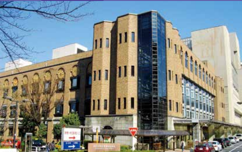
東京大学医学部附属病院