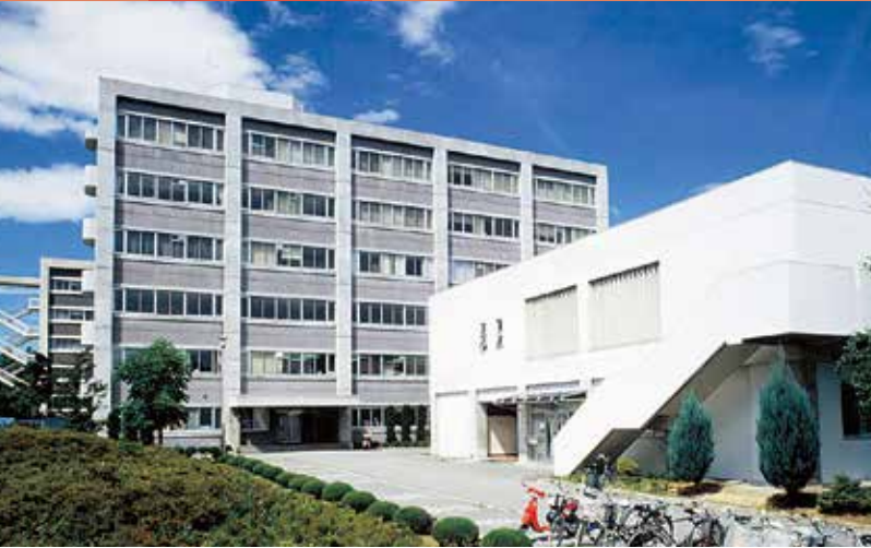
信州大学（松本キャンパス）